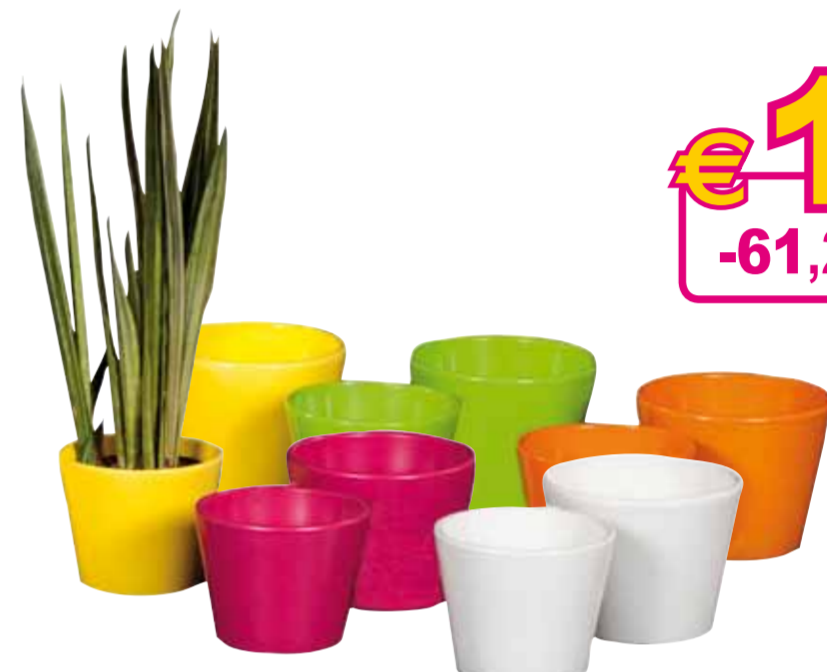
Coprivaso in ceramica

• mis.: Ø14 cm • colori assortiti Ref. 610692/93 Disponibile anche Ø16 cm anziché € 6,90 - sconto 63,7% € 2,50