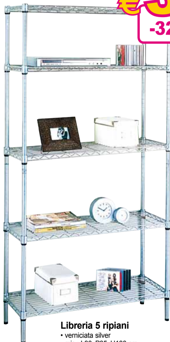
Libreria 5 ripiani • verniciata silver • mis.: L90xP35xH180 cm Ref. 529221