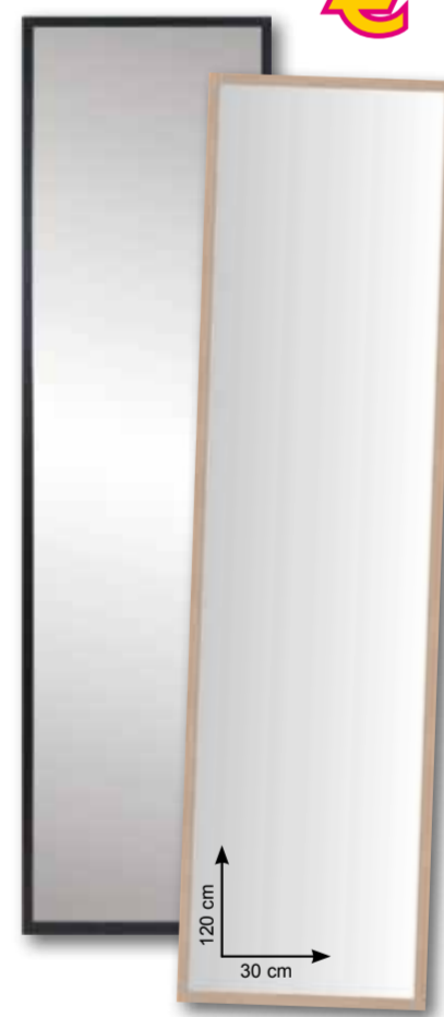
Specchio "Lario" • disponibile nei colori: bianco, nero, silver e naturale Ref. dalla 750159 alla 750162