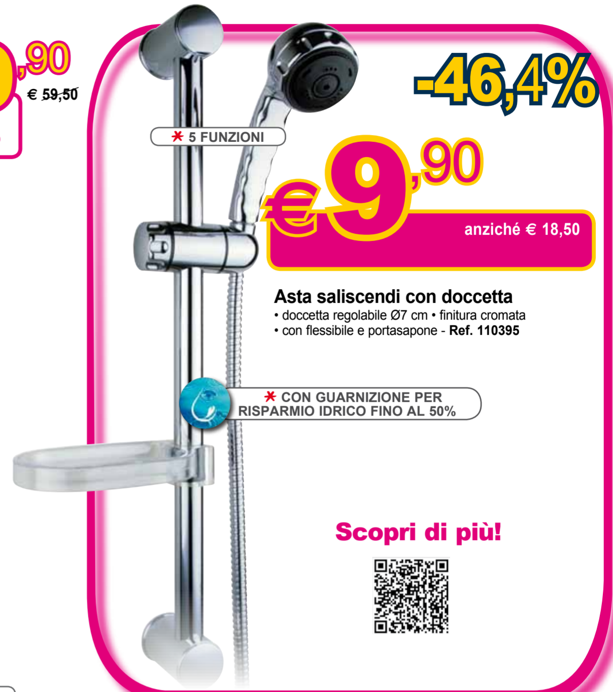
Asta saliscendi con doccia • doccia regolabile Ø7 cm • finitura cromata • con flessibile e portasapone - Ref. 110395