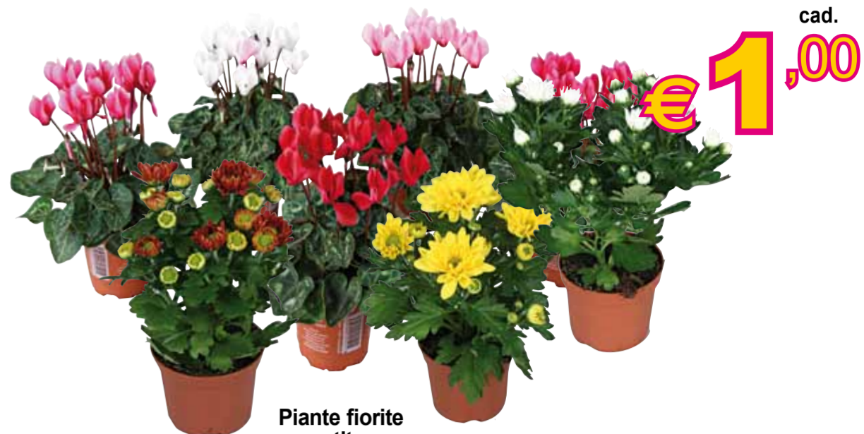
Piante fiorite assortite • vaso Ø6/10 cm Ref. 350237