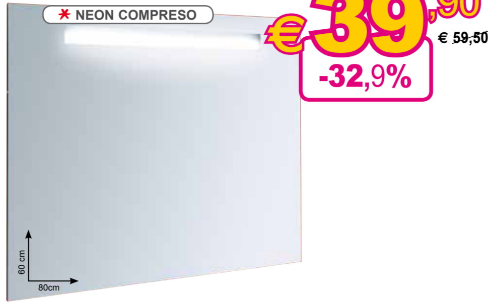
Specchio retroilluminato "Luna" • banda luminosa orizzontale • lampada fluorescente 13W Ref. 420062