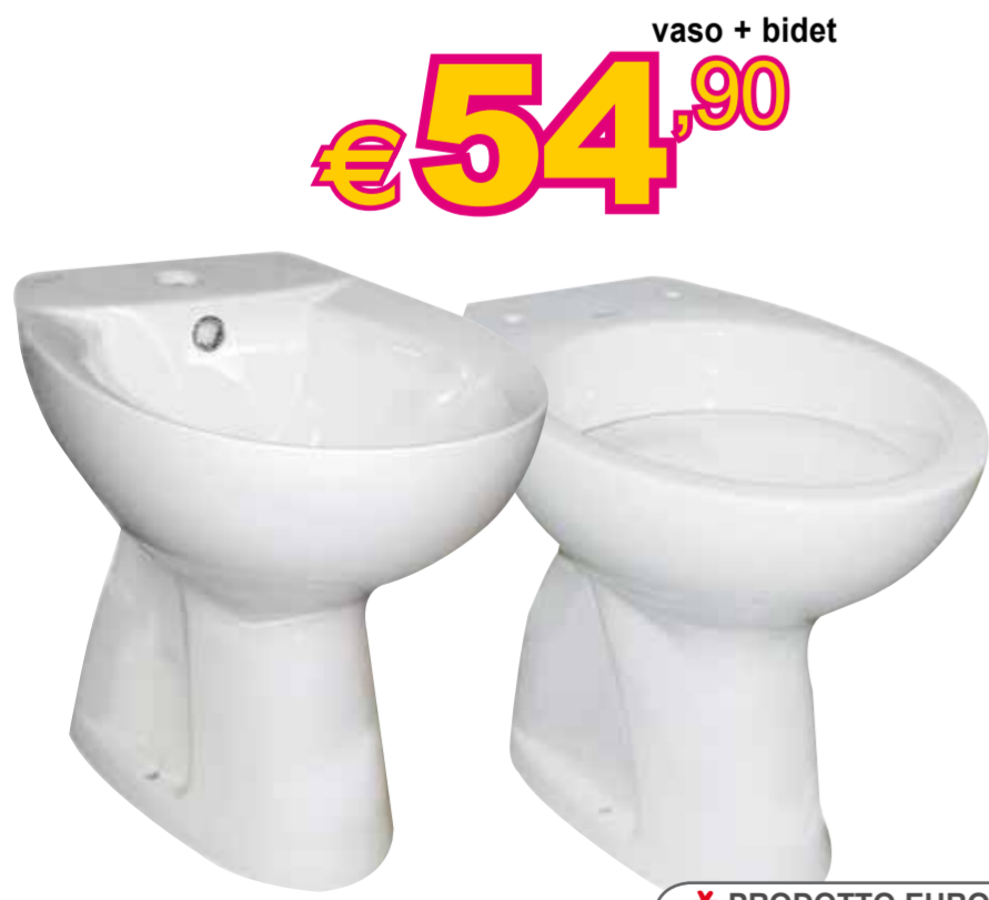
Serie sanitari "Rosy" • monoforo • in ceramica bianco europa Ref. 241571/200045 Articoli non vendibili separatamente