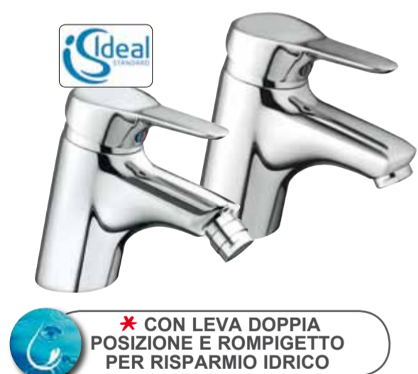
Miscelatore "Dot" Ideal Standard • in ottone cromato • cartuccia in ceramica • flessibili e piletta inclusi • sistema di montaggio "Easy fix" Bidet/Lavabo - Ref. 10003/34