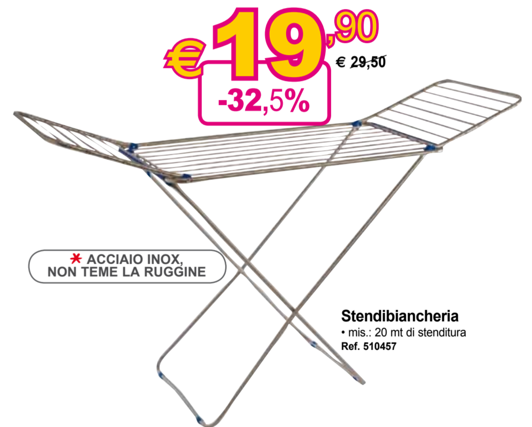
Stendibiancheria • mis.: 20 mt di stenditura Ref. 510457