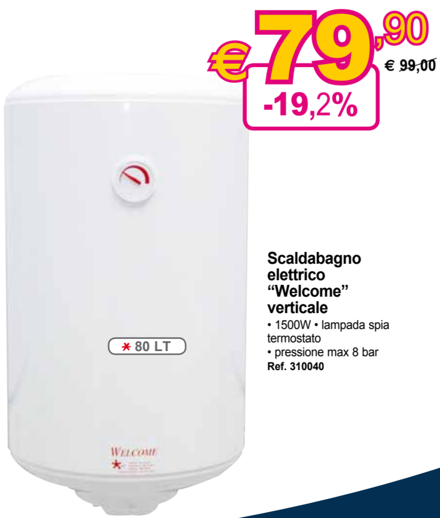
Scaldabagno elettrico "Welcome" verticale • 1500W • lampada spia termostato • pressione max 8 bar Ref. 310040