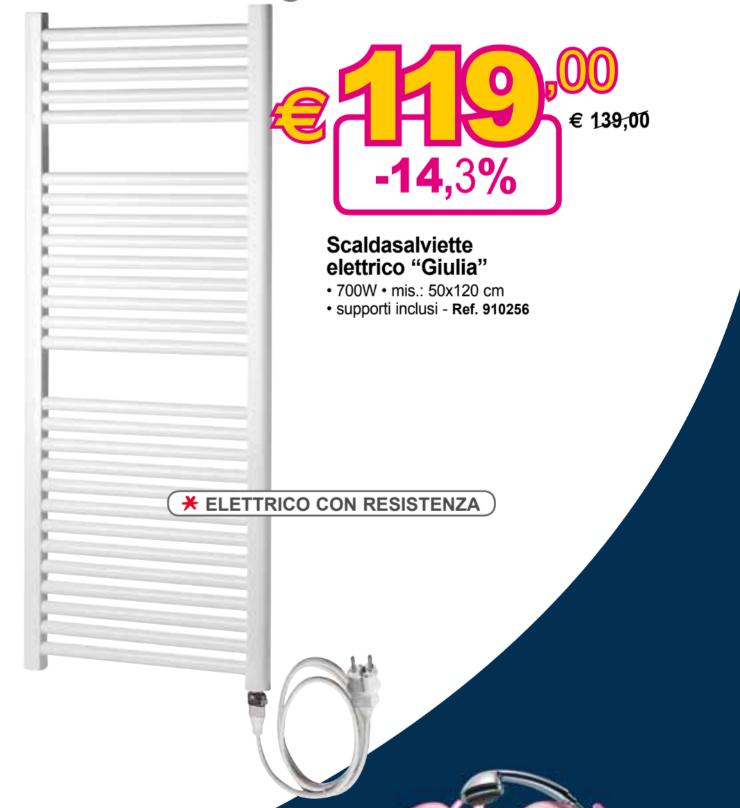
Scaldasalviette elettrico "Giulia" • 700W • mis.: 50x120 cm • supporti inclusi - Ref. 910256