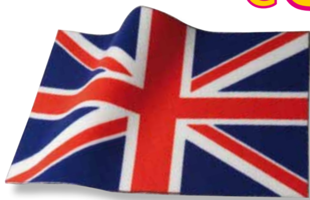
Tappetino "Bandiera UK" • mis.: 50x80 cm - Ref. 830664