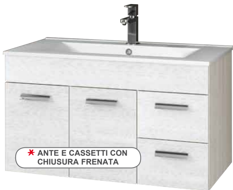
Mobile bagno sospeso "Vega" • finitura larice • composto da: base 2 ante + 2 cassetti con chiusura frenata mis.: L89xP45,5xH50 cm, lavabo in ceramica bianco mis.: L90xP46 cm, specchio a muro bordato larice mis.: L89xH80 cm, lampada cromata a led 2,2W • esclusa rubinetteria - Ref. 501493