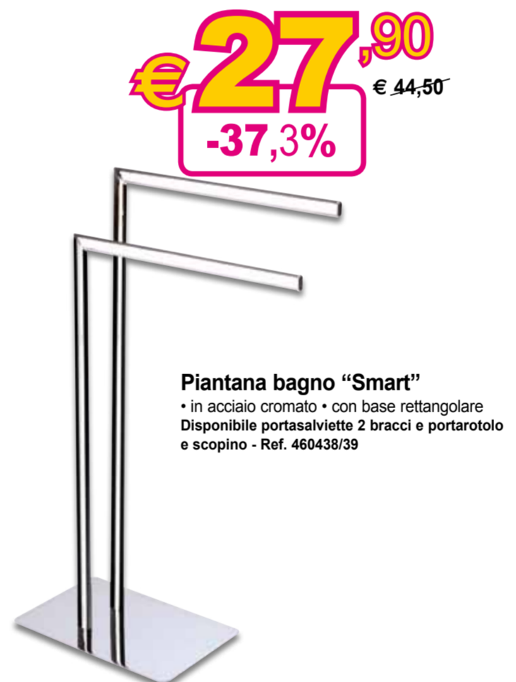
Piantana bagno "Smart" • in acciaio cromato • con base rettangolare Disponibile portasalviette 2 bracci e portarotolo e scopino - Ref. 460438/39