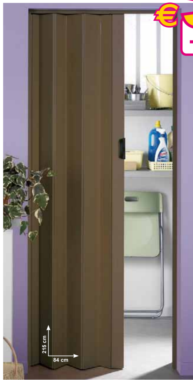
Porta soffietto "Una" • in pvc • colore noce - Ref. 110088