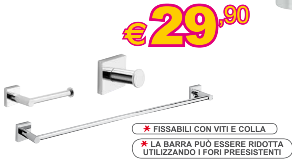
Kit accessori bagno "Sidney" • 5 pezzi: 2 appendini, 1 portarotolo, 1 portasalviette da 30 cm e uno da 60 cm • cromo - Ref. 400283