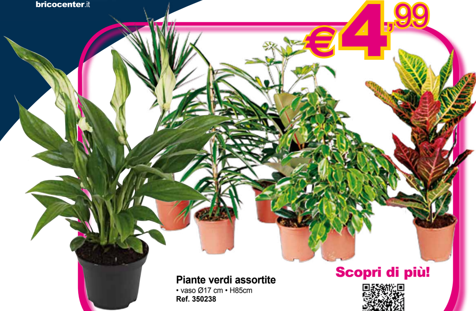
Piante verdi assortite • vaso Ø17 cm • H85cm Ref. 350238