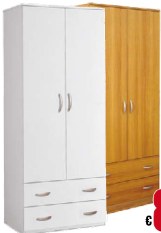
ARMADIO 2 ANTE + 2 CASS. struttura in melaminico antigraffio; maniglie a pia dini in plastica color all.; tubi appesi abiti in metallo rivestito in plastica; cerniere ante in metallo; finitura nera maderata/bianca 81x52x175