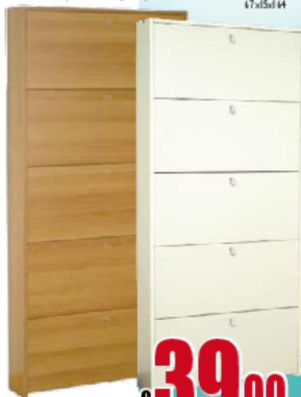
SCARPIERA A 5 RIBALTE (15 paio): struttura in melaminico antigraffio, tubi reggisuola in metallo, pia dini e maniglie in plastica; finitura nera maderata/bianca 47x55x144