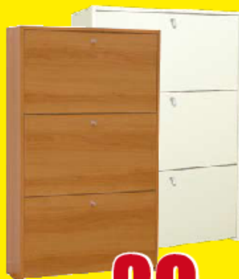
SCARPIERA A 3 RIB. Doppia prof (18 paio): struttura in melaminico antigraffio, tubi reggisuola in metallo, pia dini e maniglie in plastica; finitura nera maderata/bianca 47x22x119