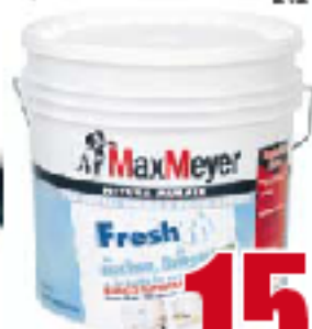
FRESH MAX MEYER (idropittura supertraspirante) latte da lt.4