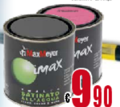
IMAX SMALTO ALL'ACQUA a base d'acqua tutti i colori barattolo da lt. 0,5