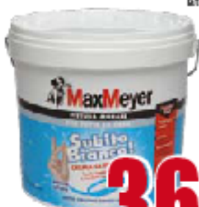
SUBITOBIANCO (pittura monocolor bianca, opaca e luminosa) latte da lt.10