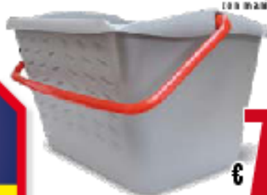
SECCHIO con manico 10