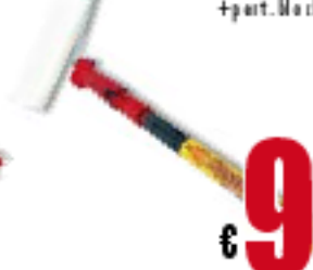
RULLO ST22 +part. Mark 110/200