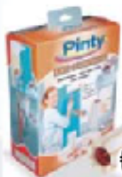
RULLO CON SERBATOIO 21 cm