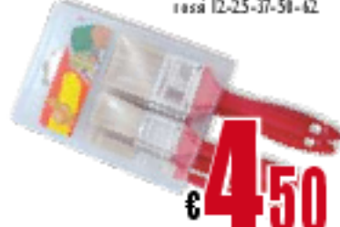
KIT 5 PENNELLI rossi 12-25-37-50-62