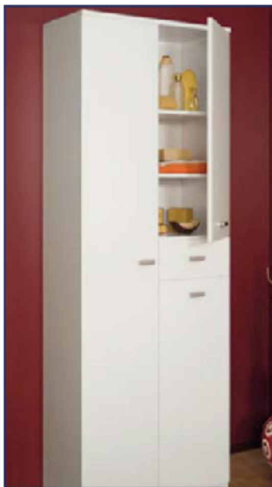
MOBILE MULTIUSO portasciopa a 3 ante + 1 cass.; melaminico antigraffio color bianco, maniglie color alluminio, zoccolo parapolvere (tot. 7 vani interni) 71x53x175