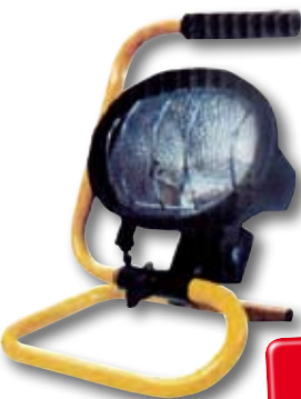
cod. 2011551 PROIETTORE ALOGENO PER ESTERNO CON MANIGLIA Supporto orientabile, struttura in pressofusione di alluminio, vetro temperato. Max 500 W, 220/240 V, lampadina R7S inclusa, classe C. Dimensioni: 23,5x13,5x32 cm