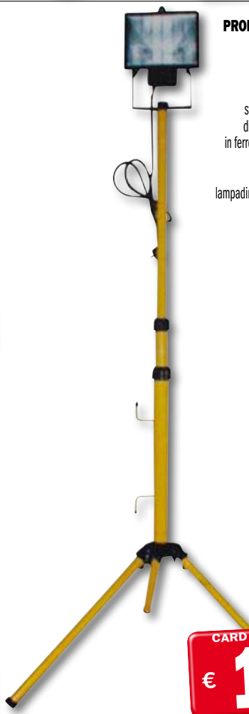
cod. 2011552 PROIETTORE ALOGENO CON TREPIEDE PER ESTERNO Regolabile in altezza, faretto orientabile struttura in pressofusione di alluminio con treppiede in ferro, cavo di alimentazione, vetro temperato. Max 500 W, 220/240 V, lampadina R7S inclusa, classe C. Dimensioni: 78x210 cm