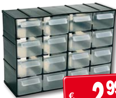
cod. 2011573 CASSETTIERA Con 16 cassette trasparenti. Dimensioni: 22,1x8,5x15,6 cm