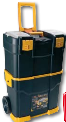
cod. 2011571 VALIGETTA CARRELLATA Con portaminuterie sul coperchio e vano inferiore per gli elettrotensili. Dimensioni: 46x28x66,5 cm