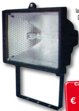
cod. 2011550 PROIETTORE ALOGENO PER ESTERNO Supporto orientabile, struttura in pressofusione di alluminio, vetro temperato. Max 500 W, 220/240 V, lampadina R7S inclusa, classe C. Dimensioni: 18,5x13,5x14,8 cm