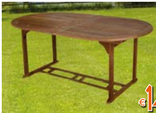
TAVOLO OVALE Allungabile. In eucalipto. LxPxH chiuso 170x100x73 cm LxPxH aperto 230x100x73 cm