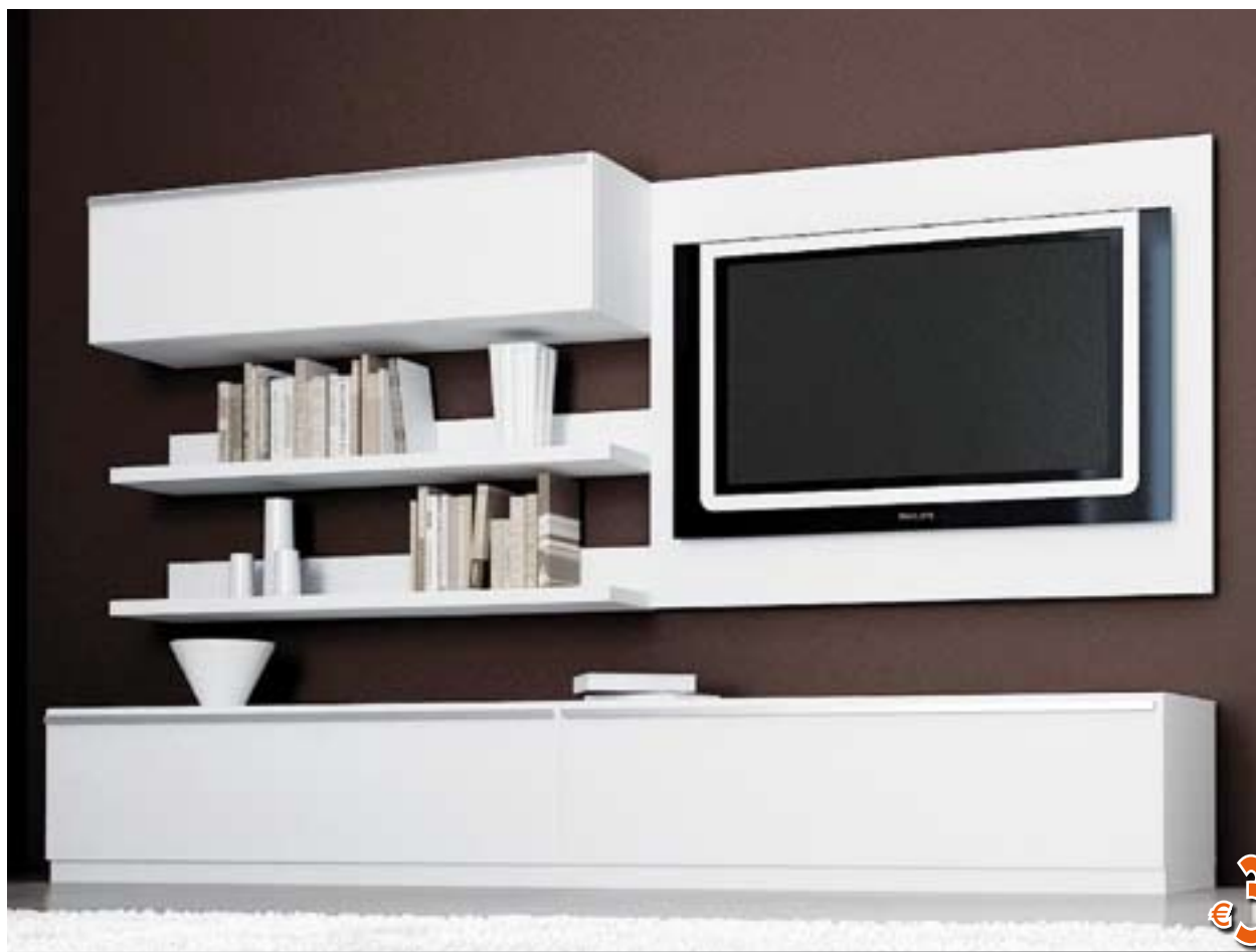
SOGGIORNO LACCATO Pensile e basi con ante a ribalta, mensole da 120 cm. Colore BIANCO. LxP 240x47 cm