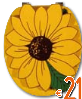
SEDILE UNIVERSALE GIRASOLI In MDF, con cerniere in metallo