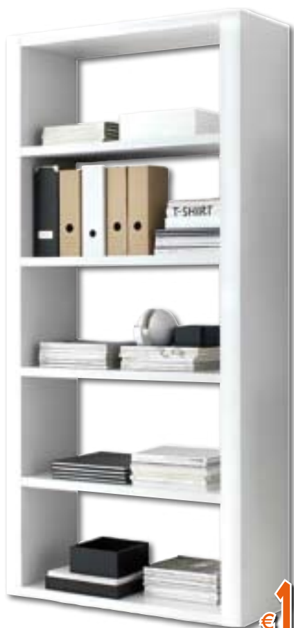
LIBRERIA LACCATA Colore BIANCO. LxPxH 95x36x211 cm