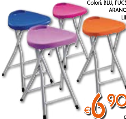
SGABELLO PIEGHEVOLE Colori: BLU, FUCSIA, ARANCIO, LILLA