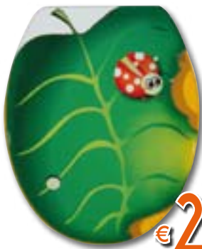
SEDILE UNIVERSALE COCCINELLA In MDF, con cerniere in metallo