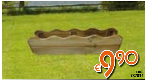
FIORIERA DA BALCONE In legno. LxPxH 80x20x20 cm