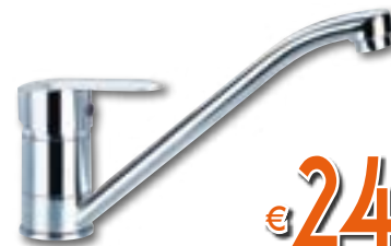
LAVELLO CUCINA TOM Bocca girevole