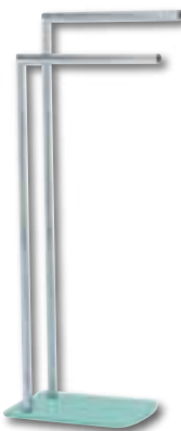
PIANTANA PORTA ASCIUGAMANI In leghe metalliche e vetro temperato sabbato