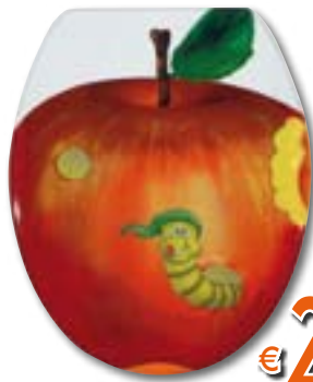
SEDILE UNIVERSALE BRUCOMELA In MDF, con cerniere in metallo