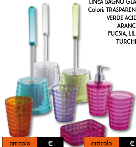
LINEA BAGNO GLADY Colori: TRASPARENTE, VERDE ACIDO, ARANCIO, FUCSIA, LILLA, TURCHESE