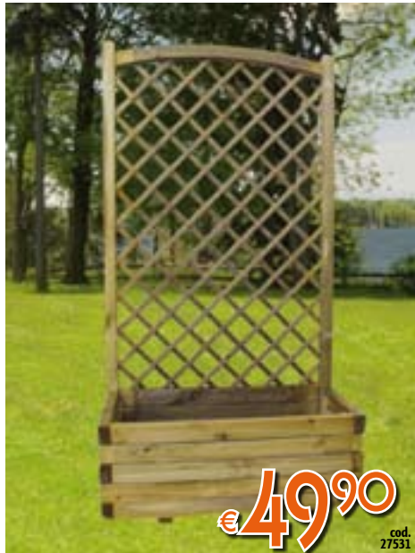
FIORIERA In legno. Con griglia. LxPxH 80x40x150 cm