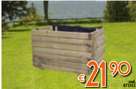
FIORIERA TETRIS In legno. Completa di guaina traspirante e permeabile per l'interno. LxPxH 60x40x40 cm