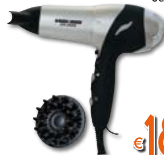
ASCIUGACAPELLI Potenza 2.000 Watt. Azione ionizzante. Accessori: concentratore d'aria e diffusore