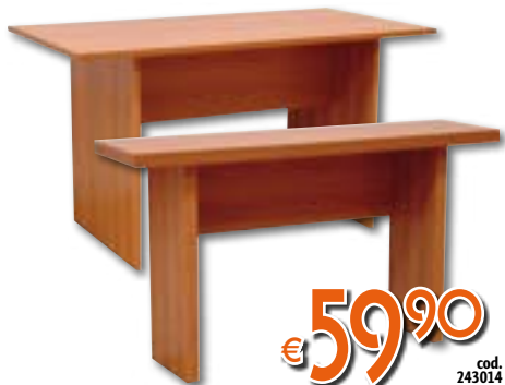
CONSOLLE A LIBRO Colore NOCE. LxPxH 138x36/72x76 cm