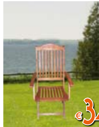
POLTRONA COAST Pieghevole. In eucalipto