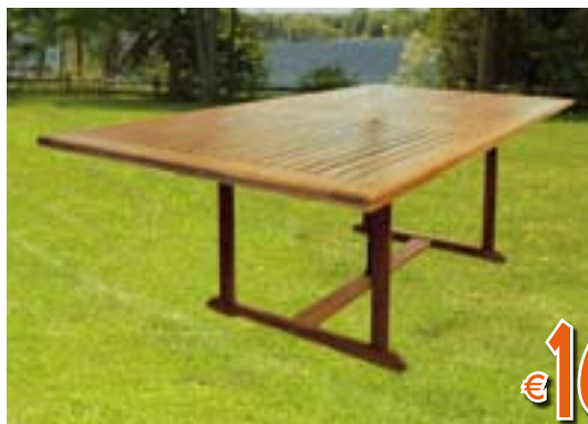
TAVOLO RETTANGOLARE Allungabile. In balau. LxPxH chiuso 160x100x73 cm LxPxH aperto 200x100x73 cm