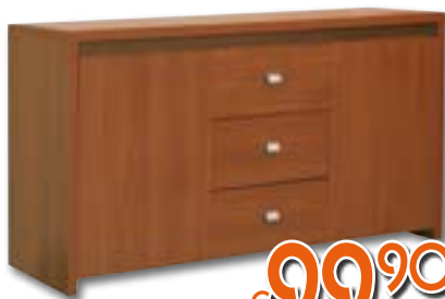
MOBILE A 2 ANTE + 3 CASSETTI Colore CILIEGIO. LxPxH 140x45x77 cm