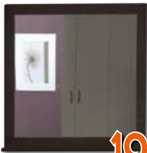
SPECCHIERA CAPRI Colore ROVERE SCURO. LxPxH 70x10x72 cm