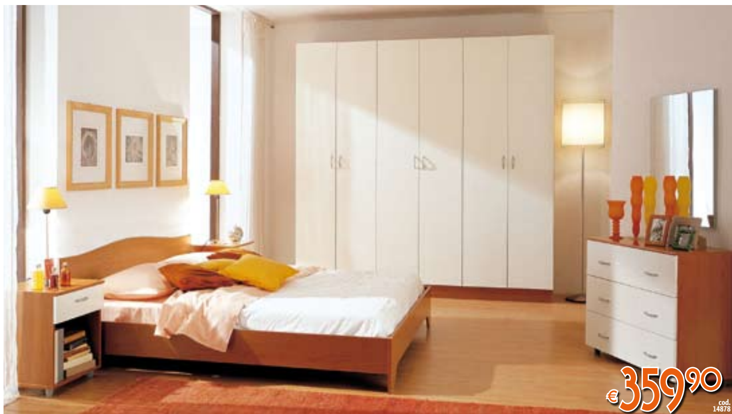
CAMERA MATRIMONIALE Completa di armadio a 6 ante + letto (esclusi rete e materasso) + 2 comodini + cassettiera + specchiera 80x60 cm. Colore CILIEGIO/MAGNOLIA