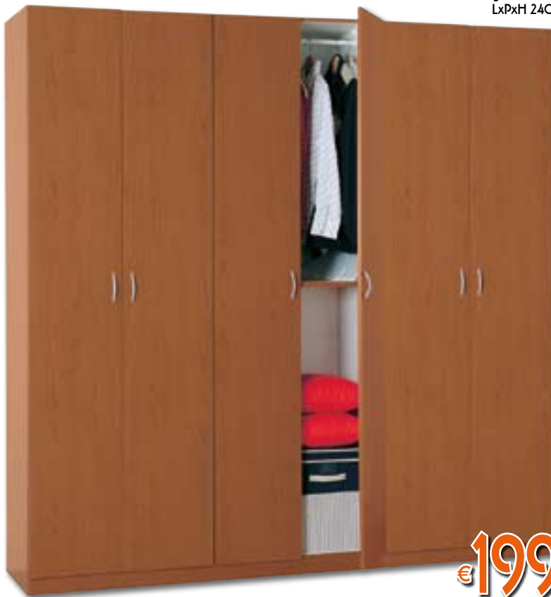
ARMADIO A 6 ANTE Spessori: struttura 16 mm, piani 16 mm, 3 tubi appendiabiti. Colore CILIEGIO con maniglie colore ALLUMINIO. LxPxH 240x52x240 cm