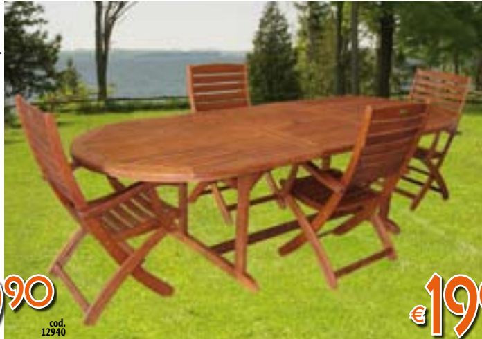
POLTRONA MONTERNA Con braccioli. Pieghevole. In balau