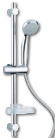
SALISCENDI AURORA In acciaio inox. Asta regolabile, doccetta a 3 getti