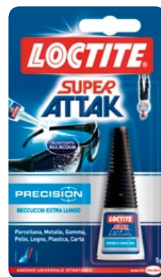
SUPER ATTACK PRECISION con beccuccio extra lungo, resistente all'acqua gr.5