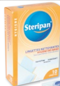
10 SALVIETTINE IGIENIZZANTI