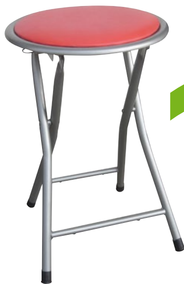
SGABELLO "POLO" CON SEDUTA IMBOTTITA IN COLORI ASSORTITI