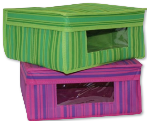
BOX MULTIUSO in tnt con finestra dim. cm.33x28x15